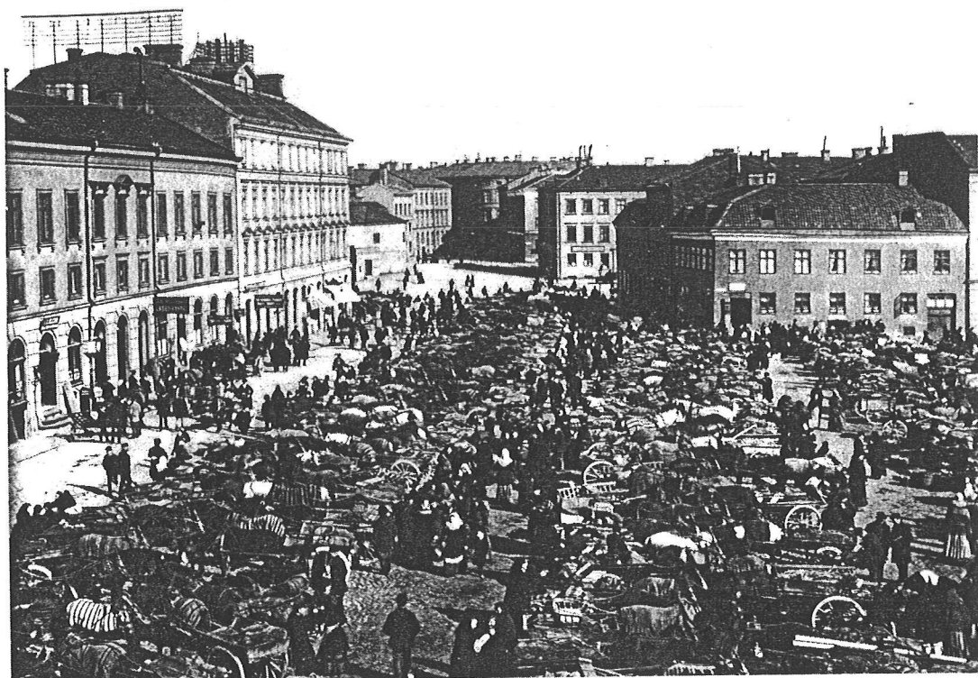
Kungstorget i Göteborg på 1880-talet.

ning av marknadsekonomi, industri, socialistiska idéer och fackföreningar, individualism och kvinnornas/döttrarnas första steg utanför Hemmets väggar. Traditionen börjar mista sin makt, 'gammal visste inte alltid bäst' i en tid som började luta framåt i stället för som dittills bakåt. 1880-talets 'Unga Sverige', tidens radikaler och kulturintelligentia, kvinnliga och manliga, hade börjat göra uppror mot gamla konventioner, normer, regler men innanför ett språk och medvetande som är genomhumaniserat, som ännu inte ersatt mänsklig konkret verklighet, moral, etik, vision med maskinens 'språk' eller storskaliga strukturer och begrepp. Tidens evolutionism, i synnerhet Spencers utvecklingsläror, medgav stor betydelse åt den enskilda människans ansvar för den sociogenetiska koden, för vilka sociala, kulturella och mänskliga kvalitéer, som skulle vidareutvecklas, förfinas och föras vidare.